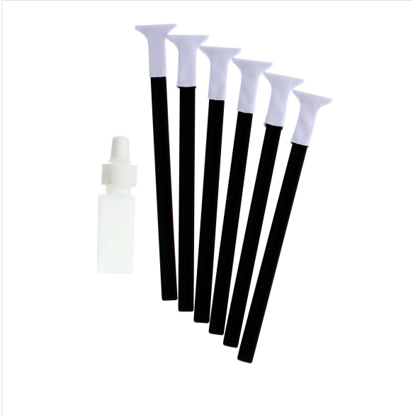
Image - Accessoires photo - Nettoyage photo

Spatules de 16 mm en PP avec revêtement en tissu. Nettoient tâches grasses et sèches. Compatible capteurs réflexe CCD et CMOS. Pack de 6 spatules et une bouteille de 3,6 ml.