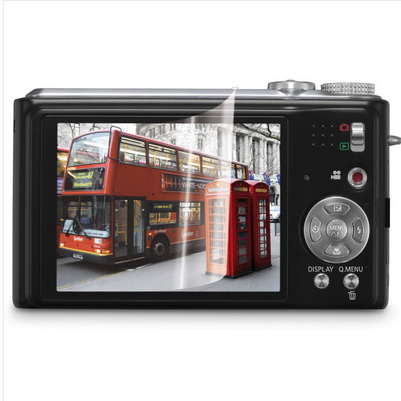
Image - Accessoires photo - Autres accessoires photo