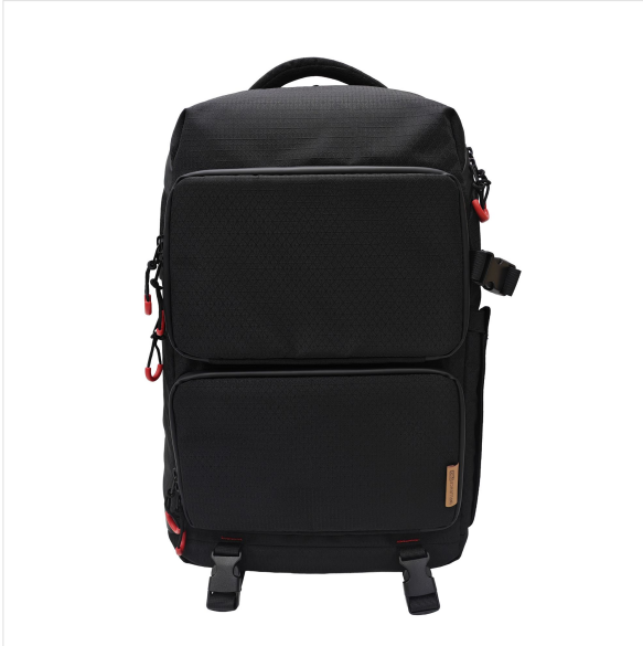
Imagen - Influencia -